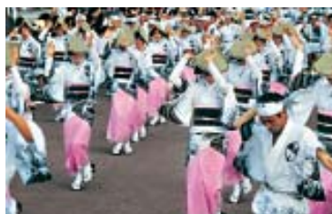
Dança Awa, em Tokushima - 12 a 15 de agosto.