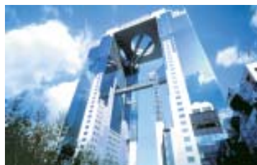
Prédio Umeda Sky, em Osaka.