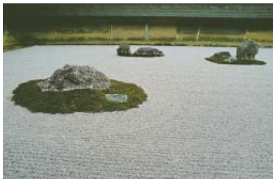
Jardim do Templo Ryoanji, em Quioto. (Pág. 23)