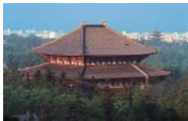
Templo Todaiji, em Nara. (Pág. 25)