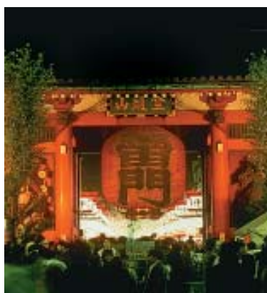
Ano Novo no Templo Asakusa Kannon, em Tóquio - 31 de dezembro. (Pág. 14)

O Japão é um país de festas populares. Todas as grandes cidades e pequenas vilas possuem suas próprias comemorações. Muitas delas têm origem num passado distante; outras são relativamente recentes. As festas ocorrem durante todo o ano, de modo que, independentemente da época escolhida, o turista poderá assistir a muitos festejos.