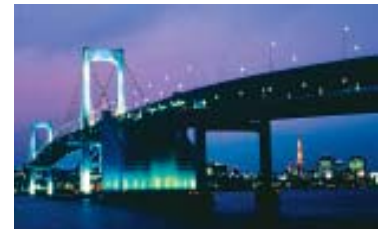
Rainbow Bridge, na Baía de Tóquio.