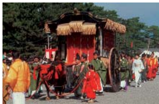
Festival Jidai, em Quioto - 22 de outubro.