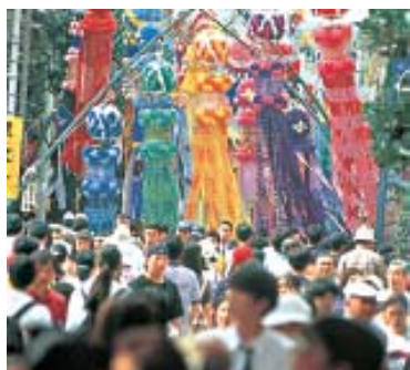
"Tanabata" Festival da Estrela em Sendai - 6 a 8 de agosto. (Pág. 13)