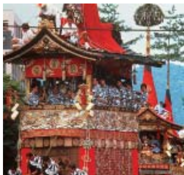
Festival Gion, em Quioto - 16 e 17 de julho (Pág. 23)