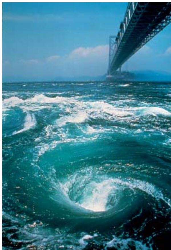
Redemoinhos de água "Naruto" e a Ponte Onaruto