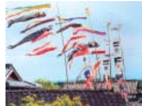
Dia dos Meninos, "Koinobori" - 5 de maio.