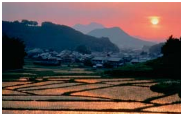
Lavoura de arroz