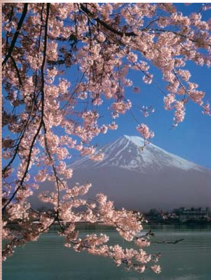
MONTE FUJI – Sem dúvida, esse elegante pico é provavelmente a mais obrigatória atração para qualquer visitante no Japão. (Págs. 18 e 19)