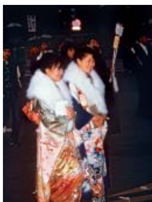
"Hatsumode", homenagem de ano novo aos santuários - 1º de janeiro.