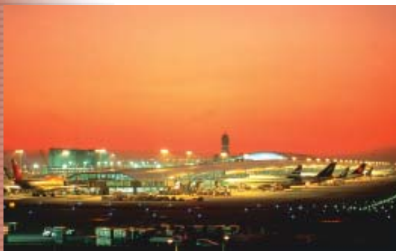
Aeroporto Internacional de Kansai, à noite. (Pág. 34)