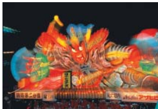
Festival de Nebuta, em Aomori - 1º a 8 de agosto.