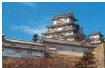
HIMEJI CASTLE: Cognominado 'Castelo da Garça Branca' é considerado Tesouro Nacional e registrado como Patrimônio Cultural do Mundo. (Pág. 26)