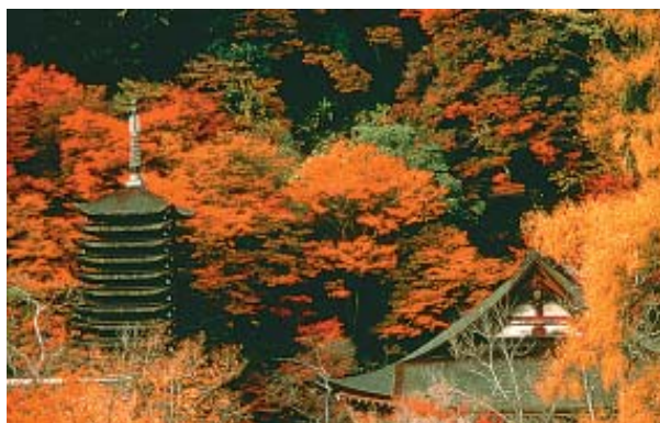
As folhas tingidas de vermelho no outono

Essas cenas evocam imagens nostálgicas do Japão e são paisagens que podem ser vistas em toda parte do país.