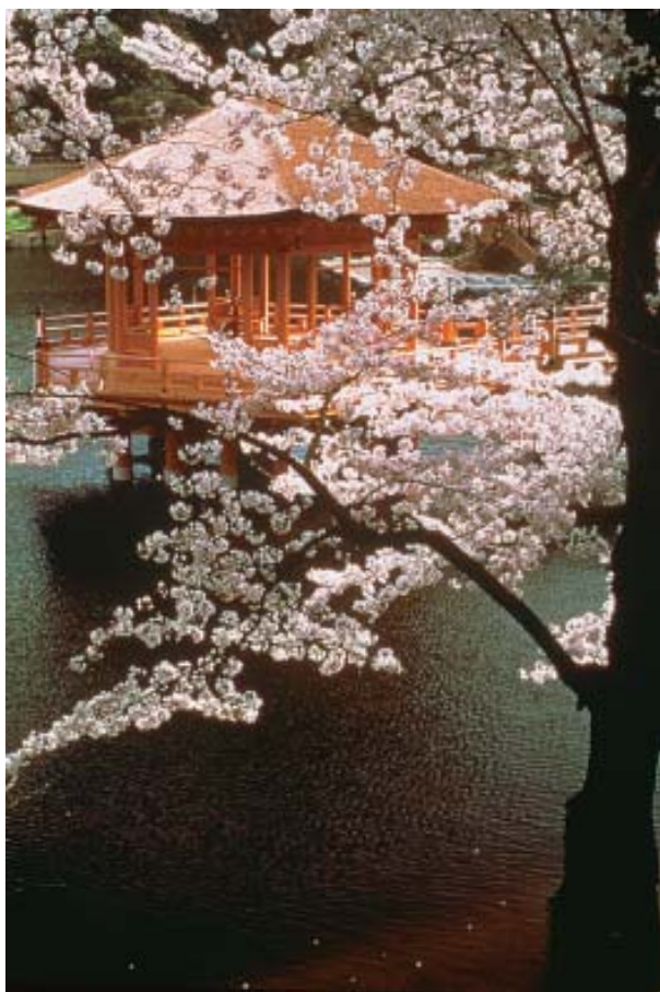
Santuário suspenso na água, "Ukiyodô", na época da cerejeira em flor, em Nara.

No início do verão, as plantações de arroz brilham com o frescor do verde das mudas dispostas ordenadamente nos arrozais cheios de água. No outono, época na qual o arroz está pronto para a colheita, os campos são drenados e transformam-se em carpetes dourados.