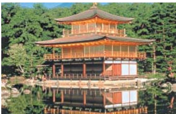
Templo Kinkakuji ou Pavilhão de Ouro, em Quioto. (Pág. 23)