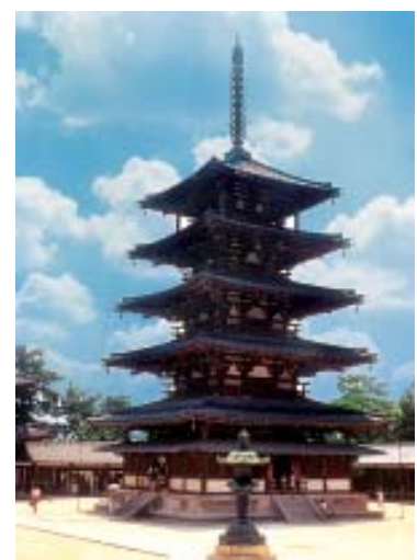
TEMPLO HORYUJI: É o templo budista mais antigo do Japão e o edifício de madeira mais antigo do mundo. Também é tombado como Patrimônio Cultural do Mundo. (Pág. 25)