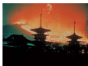
Fogueira no Monte Wakakusayama, em Nara - 15 de janeiro.