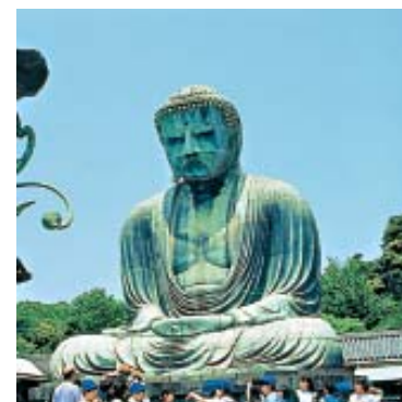
O grande Buda “Daibutsu”, em Kamakura. (Pág. 18)