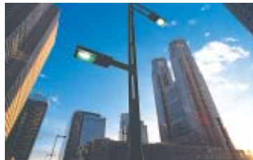
TOKYO METROPOLITAN GOVERNMENT ► (Edifício do Governo Metropolitano de Tóquio): Este edifício de duas torres geminadas se destaca altivo no distrito Shinjuku, de Tóquio. Foi projetado por Kenzo Tange.

Os estilos expressivos de hoje e os materiais utilizados são diferentes dos que foram usados no passado. Entretanto, a harmonia com a natureza é uma influência tradicional marcante, que vem continuando e se concretizando em muitas obras-mestras da arquitetura japonesa contemporânea. Esta é considerada plena de originalidade e tão excitante que você pode chamá-la de um 'produto de experimentos contínuos'. Compare as arquiteturas antigas e as modernas do Japão. Você depara com grandes surpresas e, ao mesmo tempo, fica uma impressão permanente.