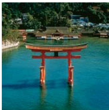
Santuário em Miyajima (Pág. 27)