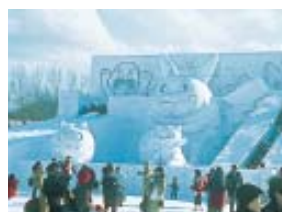
Festival da Neve de Sapporo - início de fevereiro. (Pág. 12)