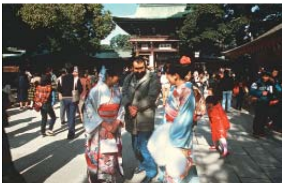
Homenagem de ano novo “Hatsumode”, no Santuário Meiji Jingu, em Tóquio. (Pág. 14)

Desde os tempos remotos, as peregrinações aos templos e santuários têm sido uma fonte de lazer e são precursoras do turismo, para os japoneses.