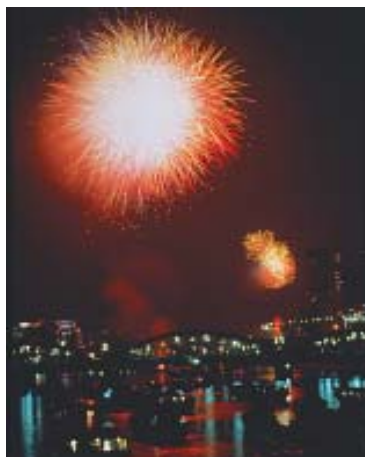
Exibição de fogos no Rio Sumida, em Tóquio - último sábado de julho.