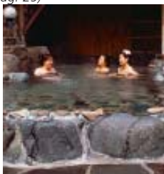
Águas termais ao ar livre de Okutsu Spa, em Okayama.