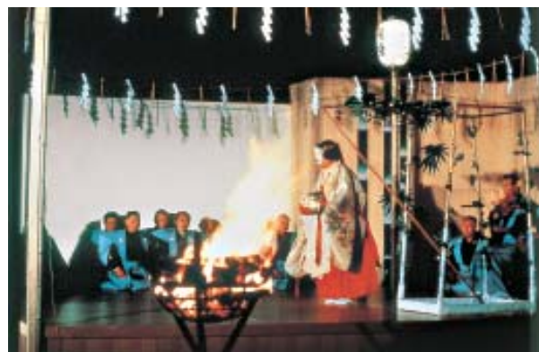
Peça de Noh “Takigi”