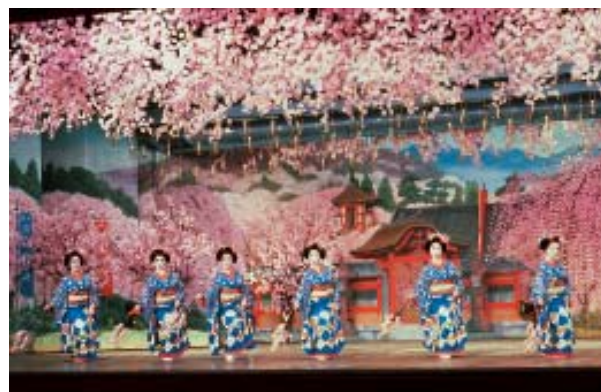
Show de dança “Miyako Odori”, em Quioto.