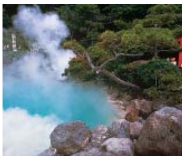
Águas termais de "Umijigoku", em Beppu. (Pág. 29)