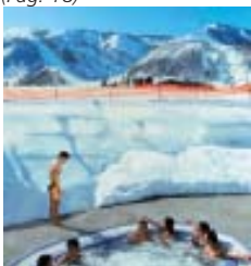
Águas termais, na Estação de Esqui Hakuba.