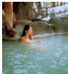
Mulher nas águas termais ao ar livre