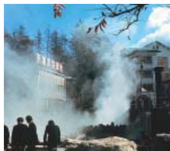
Kusatsu Spa, em Gunma.