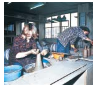
Experiência em cerâmica