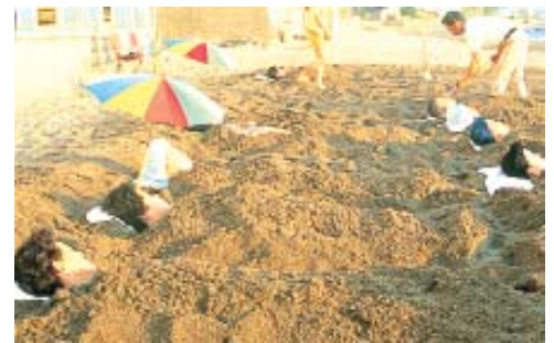
Banho de areia quente, em Ibusuki. (Pág. 29)