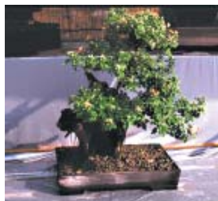
Árvore Bonsai (pág. 17)