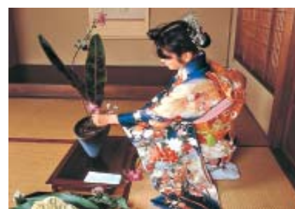
A arte de arranjo floral Ikebana