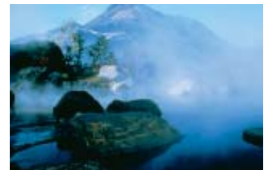
Águas termais ao ar livre