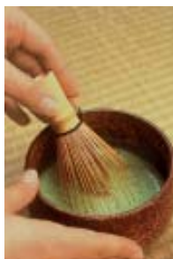
Material para fazer chá