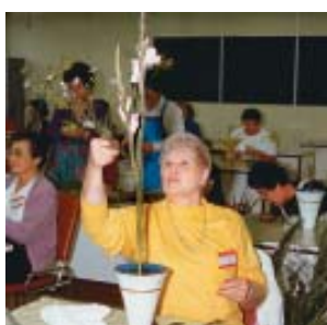
Curso de Ikebana