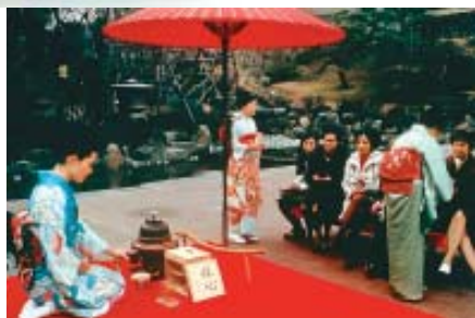
Cerimônia do chá ao ar livre - "Nodate"