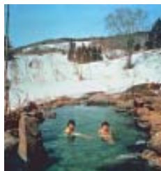
Águas termais ao ar livre de Asamushi Spa, em Aomori.