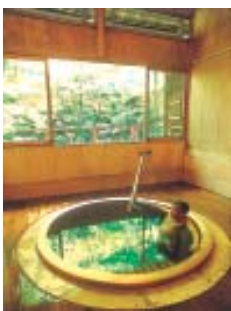
Águas termais, em Hakone. (Pág. 18)

O banho de areia quente em Ibusuki, na província de Kagoshima é outra forma de onsen a céu aberto.